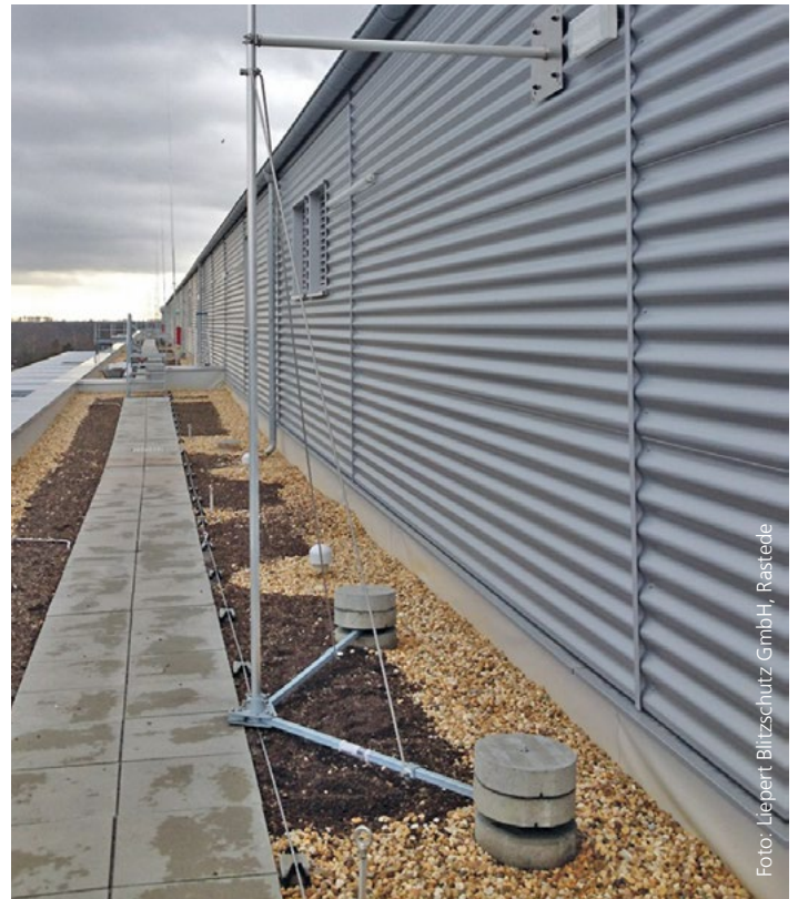
Ein Dreibeinstativ wird zum Zweibeinstativ mit Wandhalterung.