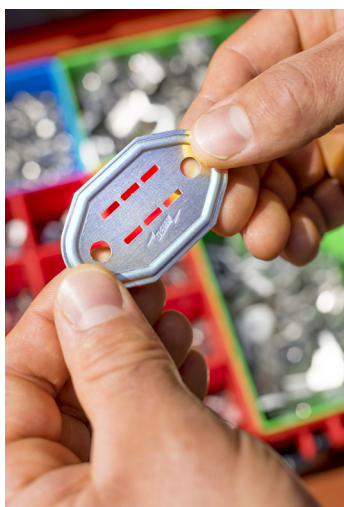
1. Schritt: Das vorgelochte Nummernschild wird entnommen.

Eine gut sichtbare und witterungsbeständige Nummerierung erleichtert die spätere regelmäßige Überprüfung und Wartung der Blitzschutz- und Erdungsanlage entsprechend den normativen Forderungen nach ÖVE/ÖNORM EN 62305-3 1) . Die dauerhafte Dokumentation der Blitzschutz- und Erdungsanlage nach ÖVE/ÖNORM E 8014 wird unterstützt.