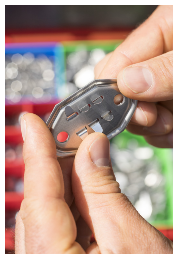
3. Schritt: Zur Fixierung werden die Nummerneinsätze auf der Rückseite umgebogen (Biegemechanismus).