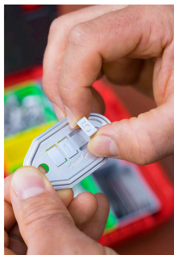
2. Schritt: Die Nummerneinsätze mit vorgeprägter Nummerierung werden aufgesteckt.